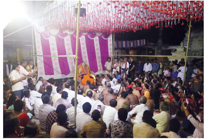
24-02-23 (శుక్రవారం) - పూజ్యశ్రీ స్వామివారు మఠం శిబిరానికి ఆనుకుని ఉన్న నాగవల్లి నదిని దర్శించుకున్నారు. అరసవల్లి ఆలయ పండితులచే కంచిపీఠంలో వేదపారాయణం చేయించి, కోలాటం, దీపపూజ నిర్వహించారు.