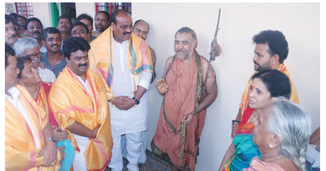
శ్రీకాకుళం ఎమ్మెల్యే అచ్చన్ననాయుడు, మాజీ ఎమ్మెల్యే రామ్మోహన్ నాయుడు, శ్రీకాకాకుళం ఎంపి కోన రవి కుమార్ పూజ్యశ్రీ స్వామివారిని దర్శించి ఆశీస్సులు తీసుకున్న సందర్భం.