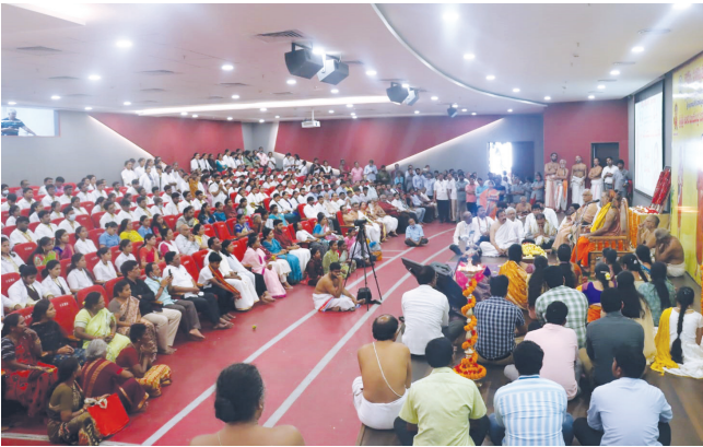
26-02-23 (భాను సప్తమి, ఉదయం) - పూజ్యశ్రీ శంకర విజయేంద్ర సరస్వతి స్వామివారు శ్రీకాకాకుళం సమీపంలోని శ్రీ అరసవల్లి సూర్యనారాయణ స్వామి ఆలయాన్ని సందర్శించి భక్తులకు అనుగ్రహ భాషణం మరియు ఆశీస్సులు అందించారు.