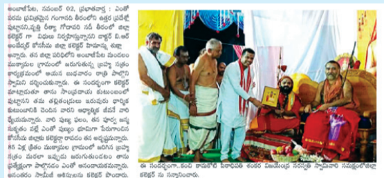
ఈ సందర్భంగా, కంచి కామకోటి పీఠాధిపతి శంకర విజయేంద్ర సరస్వతీ స్వామివారు కలెక్టర్ ను సన్మానించారు.